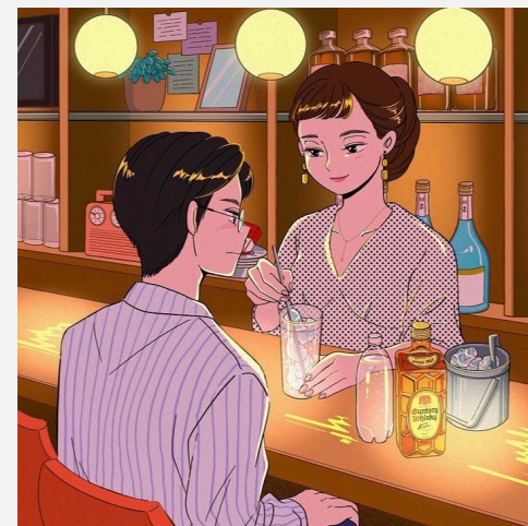
サントリー「ひとくちGif」 PRビジュアル