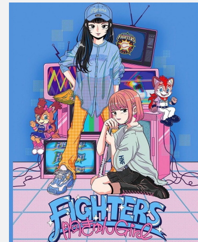
北海道日本ハムファイターズ ファイターズガールズシリーズ 2021 - 胸キュンFestival - キービジュアル