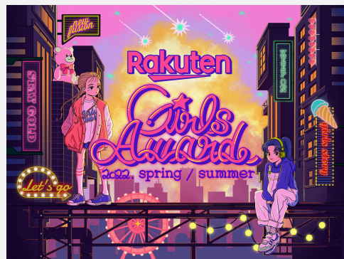
Rakuten GirlsAward 2022 SPRING / SUMMER キービジュアル